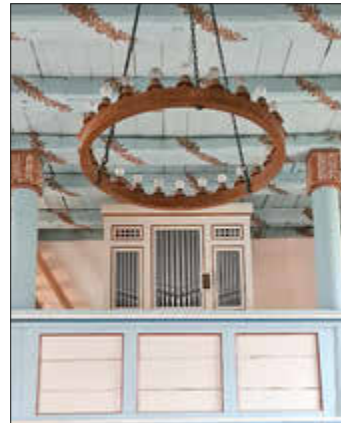
Grüneberg-Organ in Schwichtenberg

10:30 Uhr Gottesdienst, St. Marienkirche Friedland