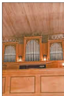
Ernst Sauer Orgel in Schwanbeck

17:15 Uhr Kirche Schwanbeck, (Orgel von Ernst Sauer, gebaut 1858)